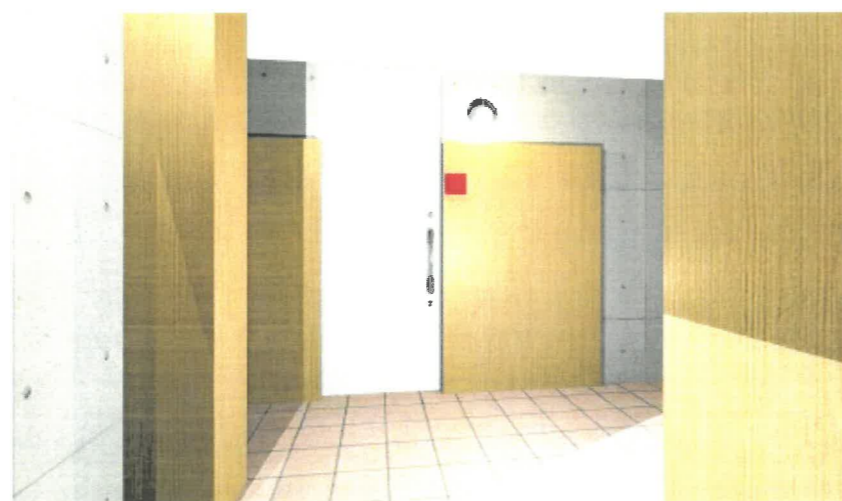
玄関・エレベーターホール イメージ図