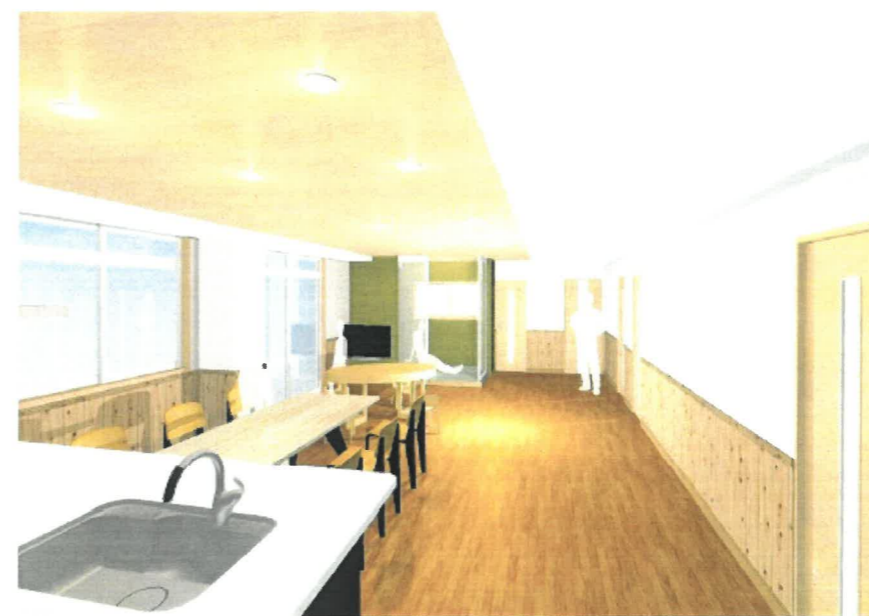
リビングダイニングイメージ図