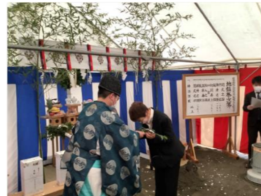
2月13日 二宮神社の神主さんをお招きして、地鎮祭を行いました。