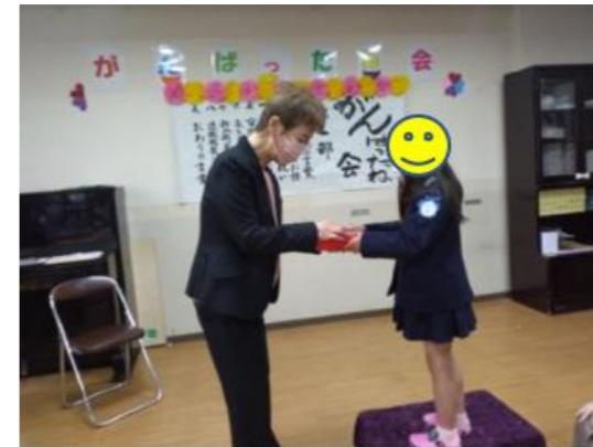
3月21日 みんなで集まってがんばったね会を行いました。