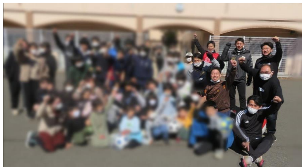
2月25日 TOCAR FOOTBALL協会さんによるサッカー教室が開催されました。