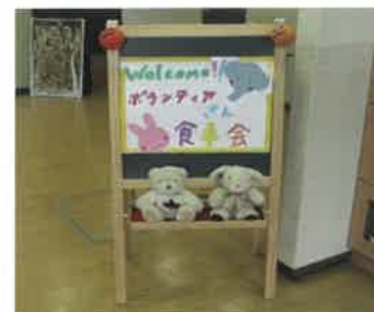
おんちよう園のボランティアさん

この時期は、出会いと別れがつきものですが、気持ちも新たに前向きに頑張っていこうね!!